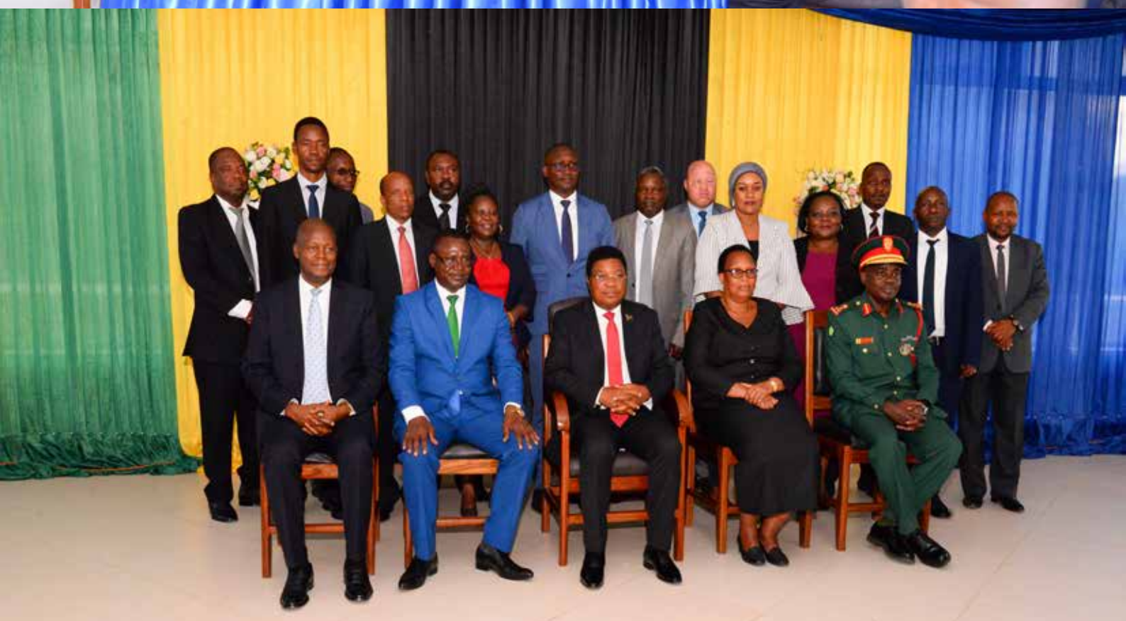
Waziri Mkuu, Kassim Majaliwa akiwa kwenye picha ya pamoja na Makatibu wa Ofisi yake na Wakuu wa Idara na Vitengo kutoka Ofisi ya Waziri Mkuu - Kazi, Vijana, Ajira na Wenye Ulemavu