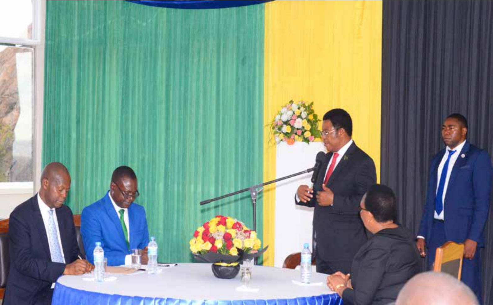
Waziri Mkuu, Kassim Majaliwa akizungumza na Makatibu wa Ofisi yake, Wakuu wa Idara na Vitengo pamoja na Watendaji Wakuu wa Taasisi zilizopo chini ya Ofisi ya Waziri Mkuu baada ya kuapishwa na Rais wa Jamhuri wa Tanzania, Mhe. Dkt. John Pombe Magufuli